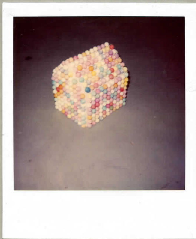
MAQUETTE Carton-mousse , boules de cotillon 20 X 20 X 20 cm

François DUCONSEILLE 24, rue du Nideck 67000 STRASBOURG Tél. 88.22.13.49